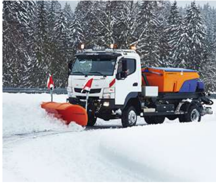
Stratos 4.0 - 12.0 m 3 Spreder