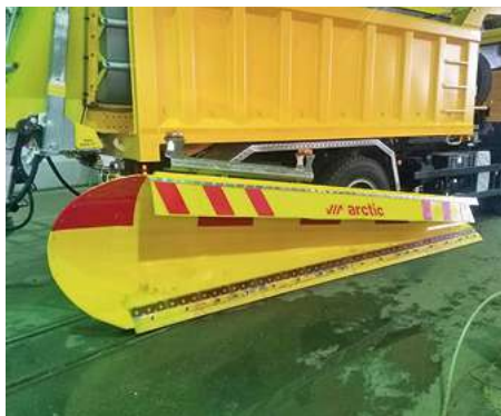
SHJ 216 J